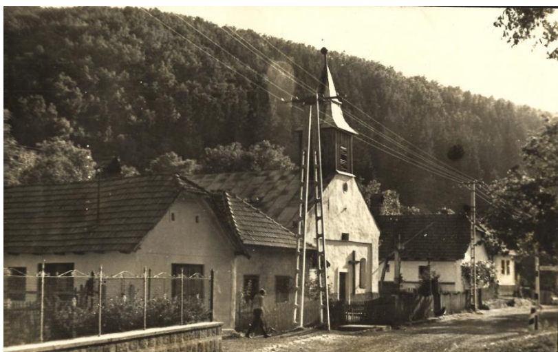
A templom és környezete az 1960-as évek második felében.