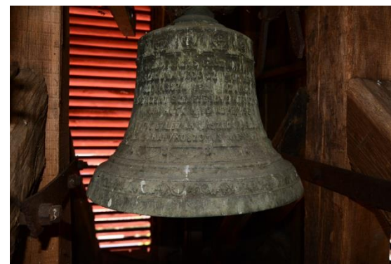
A templom 1871-ben (felül) és 1932-ben (alul) öntött harangjai.