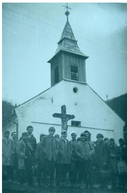
A templom és környezete az 1940/50-es években. / A templom 1964-ben hajduböszörményi diákokkal.